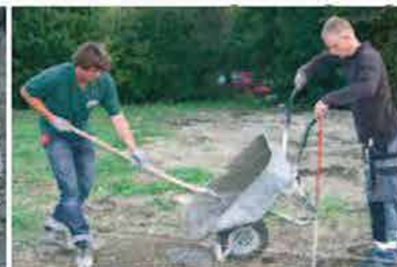
Erdloch mit Beton ausfüllen.