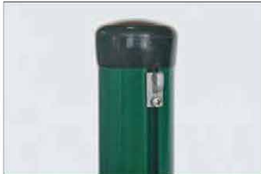
Drahthalter für Mittelpfahl