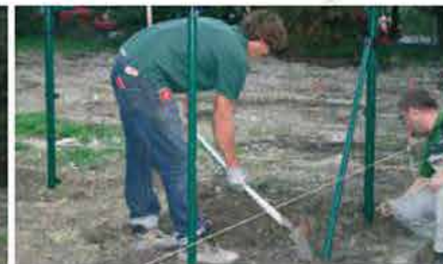
Nach Aushärtung des Betons kann das Erdloch mit Erde aufgefüllt werden.