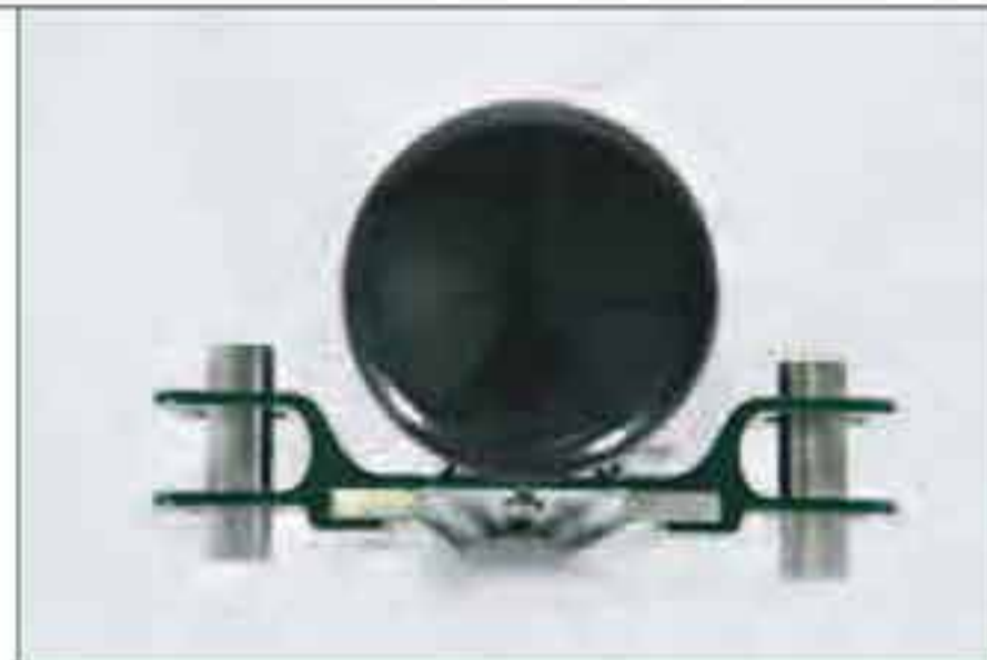
Drahtspanner für Spannpfahl