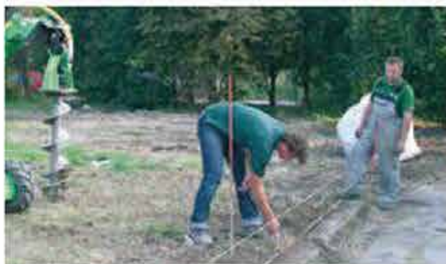
Den Zaunverlauf festlegen und mit einer Richtschnur markieren.