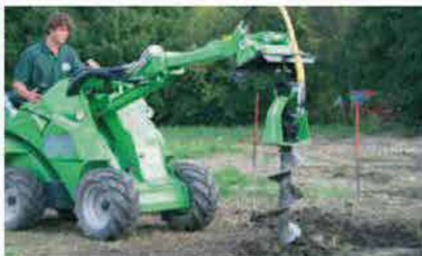
Für jeden Zaunpfahl ein Erdloch bohren (graben).