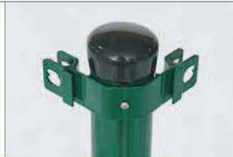
Drahtspanner für Eckpfahl