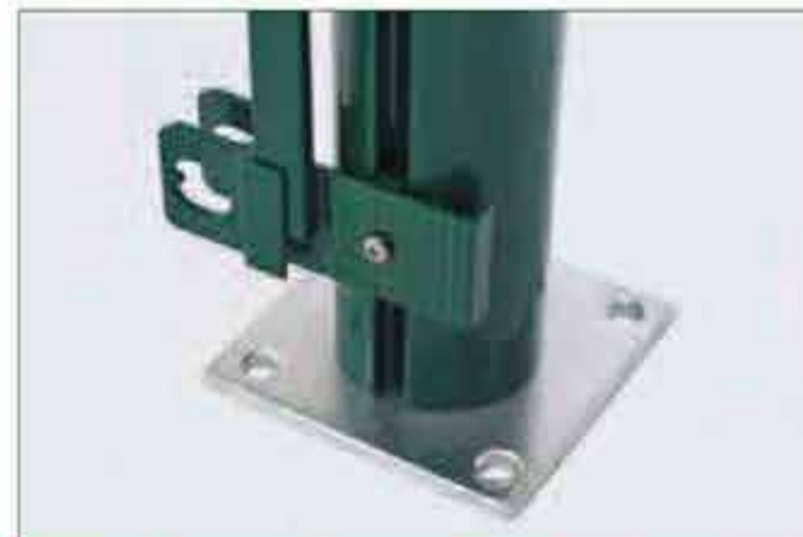
Dübelkonsole zum Befestigen aller Zaunpfähle auf Betonsockel