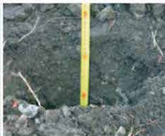
Erdlochtiefe: Frostfrei (mind. 80cm)