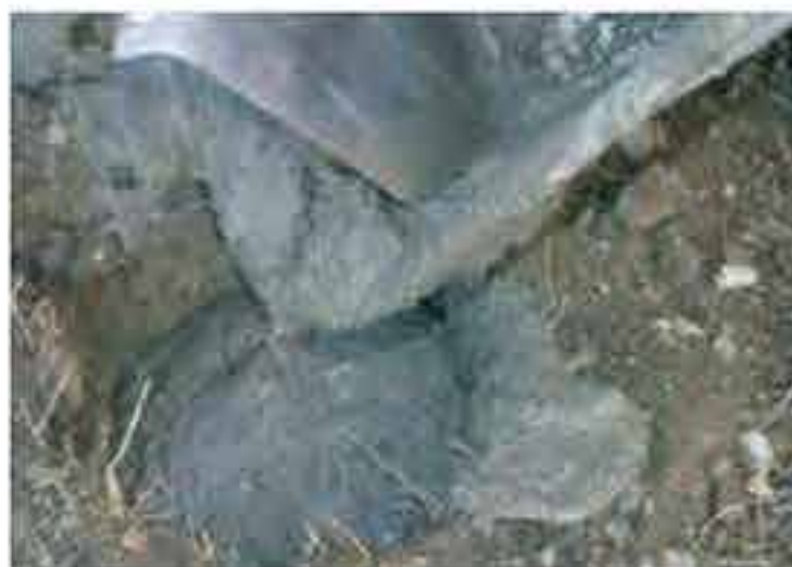
Beton ca. 5-10cm unter dem Niveau.