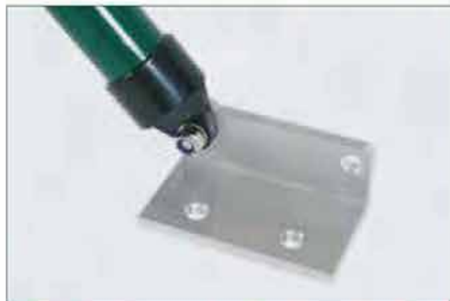
Befestigung der Strebe mittels Montagekonsole auf Betonsockel