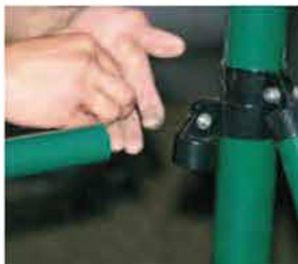
Streben mit Spannpfahl mittels Streben- selle verbinden.