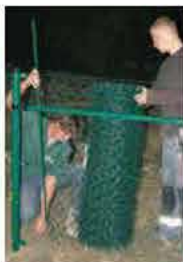
Bei Endpfahl mit der Geflechtsmontage beginnen. Mit Hilfe der Geflechtsleiste wird das Geflecht gespannt und an der Spannsäule fixiert.