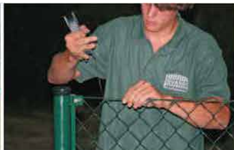
Mittels Nähdraht das Geflecht an den Spanndrähten festwickeln.