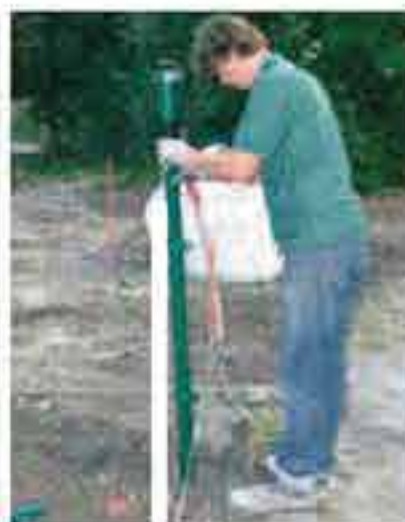
Den Zaunpfahl so aufstellen, dass die Befestigungsnut zur Aussenseite des Grundstückes zeigt und an der Richtschnur anliegt. Zaunpfahl in die Waage richten.