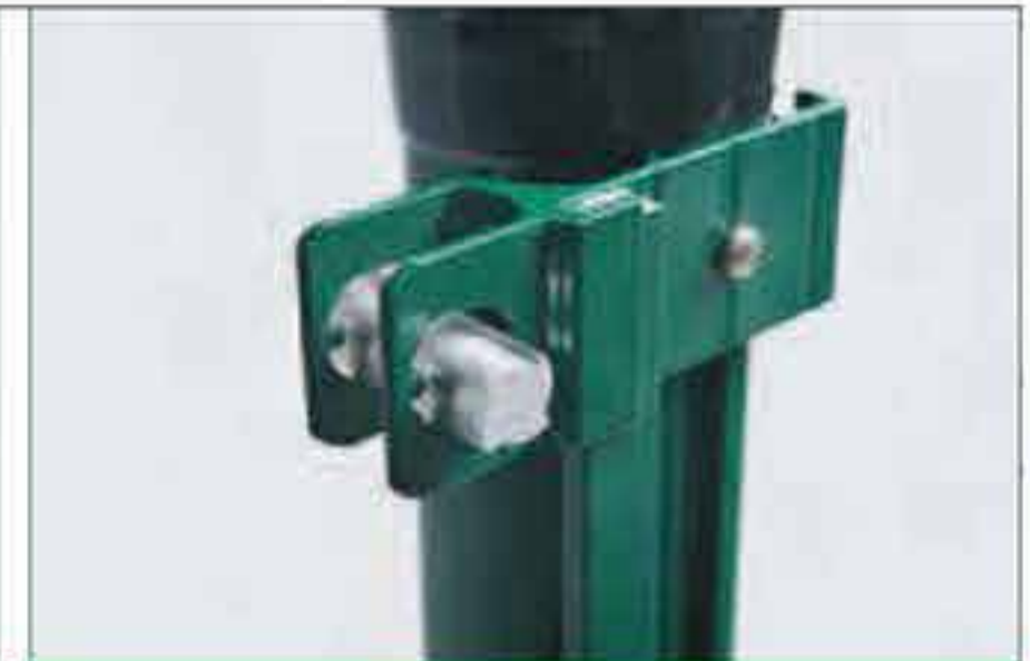
Drahtspanner für Endpfahl